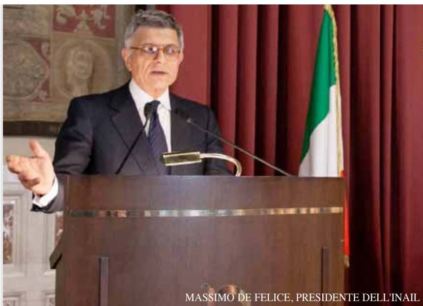
MASSIMO DE FELICE, PRESIDENTE DELL'INAIL

Le denunce di malattia professionale protocollate dall'Inail nel 2017 sono state circa 58 mila, circa 2.200 in meno rispetto al 2016, ma in aumento di circa il 25% rispetto al 2012. Ne è stata riconosciuta la causa professionale al 33%, mentre il 3% è ancora "in istruttoria". Il 65% delle denunce riguarda patologie del sistema osteomuscolare. Le denunce riguardano le malattie e non i soggetti ammalati, che sono circa 43 mila, il 37% dei quali per causa professionale riconosciuta. Sono stati poco meno di 1.400 i lavoratori con malattia asbesto-correlata. I lavoratori deceduti nel 2017 con riconoscimento di malattia professionale sono stati 1.206 (il 37% in meno rispetto al 2012), di cui 335 per silicosi/asbestosi (l'86% con età al decesso maggiore di 74 anni, il 75% con età maggiore di 79 anni). Dopo la diminuzione registrata nel corso di tutto il 2017, nei primi cinque mesi del 2018 le denunce di malattia professionale sono tornate ad aumentare, anche se a un ritmo più lento rispetto alle quattro rilevazioni mensili precedenti. Al 31 maggio 2018, infatti, l'incremento si è attestato al +3,1%, pari a 818 casi in più rispetto allo stesso periodo del 2017 (da 26.195 a 27.013).