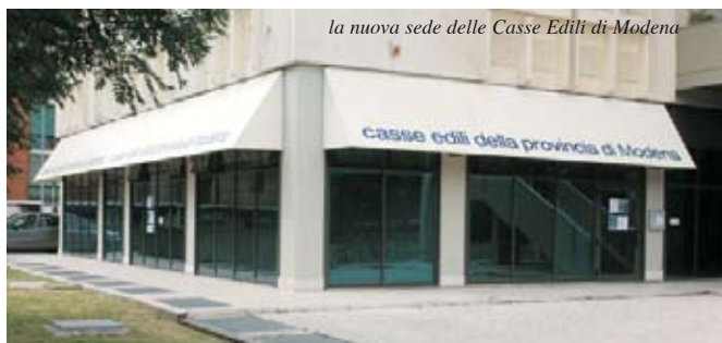
la nuova sede delle Casse Edili di Modena